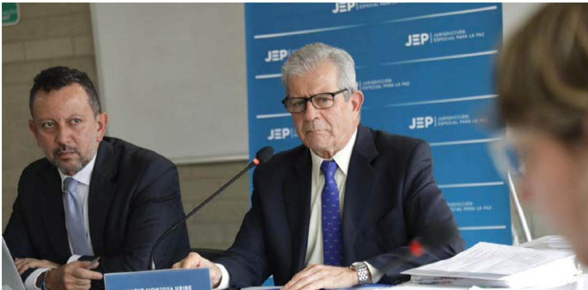
El general en retiro Mario Montoya Uribe, junto a su abogado nuevamente frente a la JEP