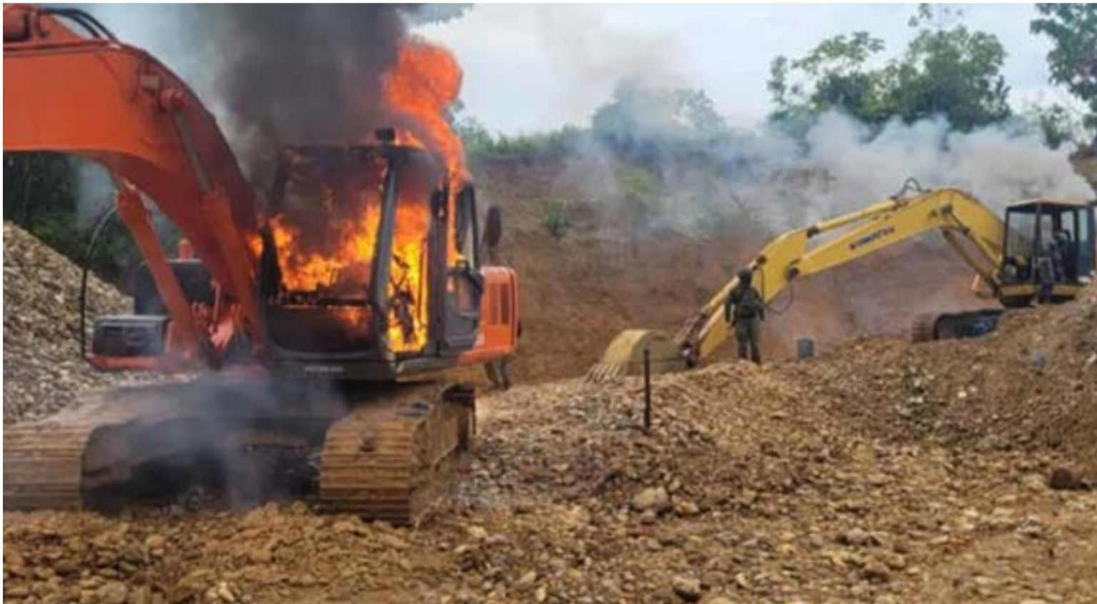
Maquinaria destruida por el Ejército de Colombia.

coordinada de la Fuerza Pública en contra de la explotación ilícita de yacimientos mineros. En las acciones intervino la Unidad Nacional Contra la Minería Ilegal y Antiterrorismo de la Policía Nacional con el apoyo del Comando Aéreo de Combate de la Fuerza Aeroespacial Colombiana.