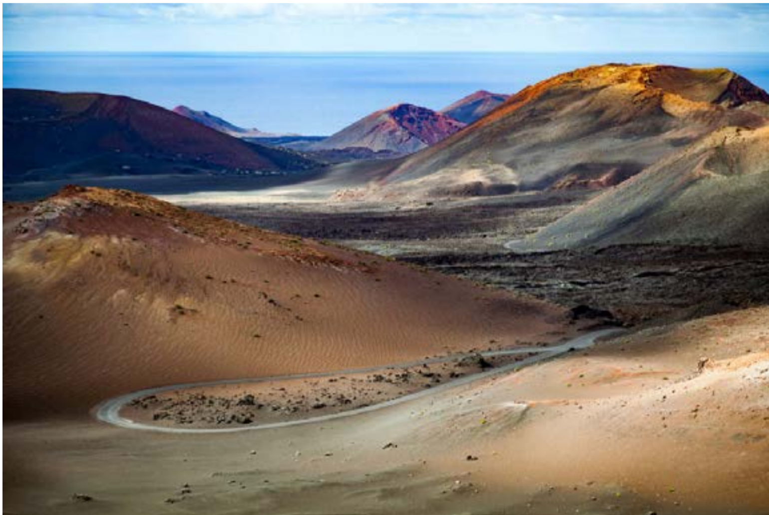
La belleza poética de la desolación de estas tierras que surgieron tras erupciones volcánicas en 1730 y 1736 no tiene comparación. El viajero puede recorrer este Parque Nacional a través de la Ruta de los Volcanes en vehículos acondicionados y contemplar, por ejemplo, 25 cráteres dormidos.

El viaje hacia el centro del parque se realiza a través de una carretera que serpentea entre malpaíses: campos infinitos de lava rugosa, retorcida y petrificada que adoptan formas casi humanas, como si las almas de la vieja isla hubiesen quedado atrapadas en la pie-