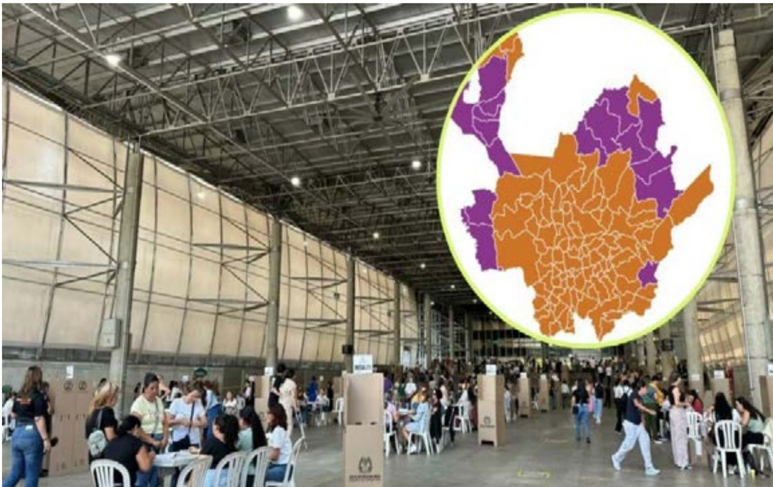
Antioquia decidió el ganador de la primera vuelta presidencial.

Aunque a muchos no les guste, Antioquia decidió el ganador de la primera vuelta presidencial. Si se repasan las cifras vemos que sin el territorio paisa Cepeda habría sacado en su totalidad en el país, 8.882.000 votos y De la Es-