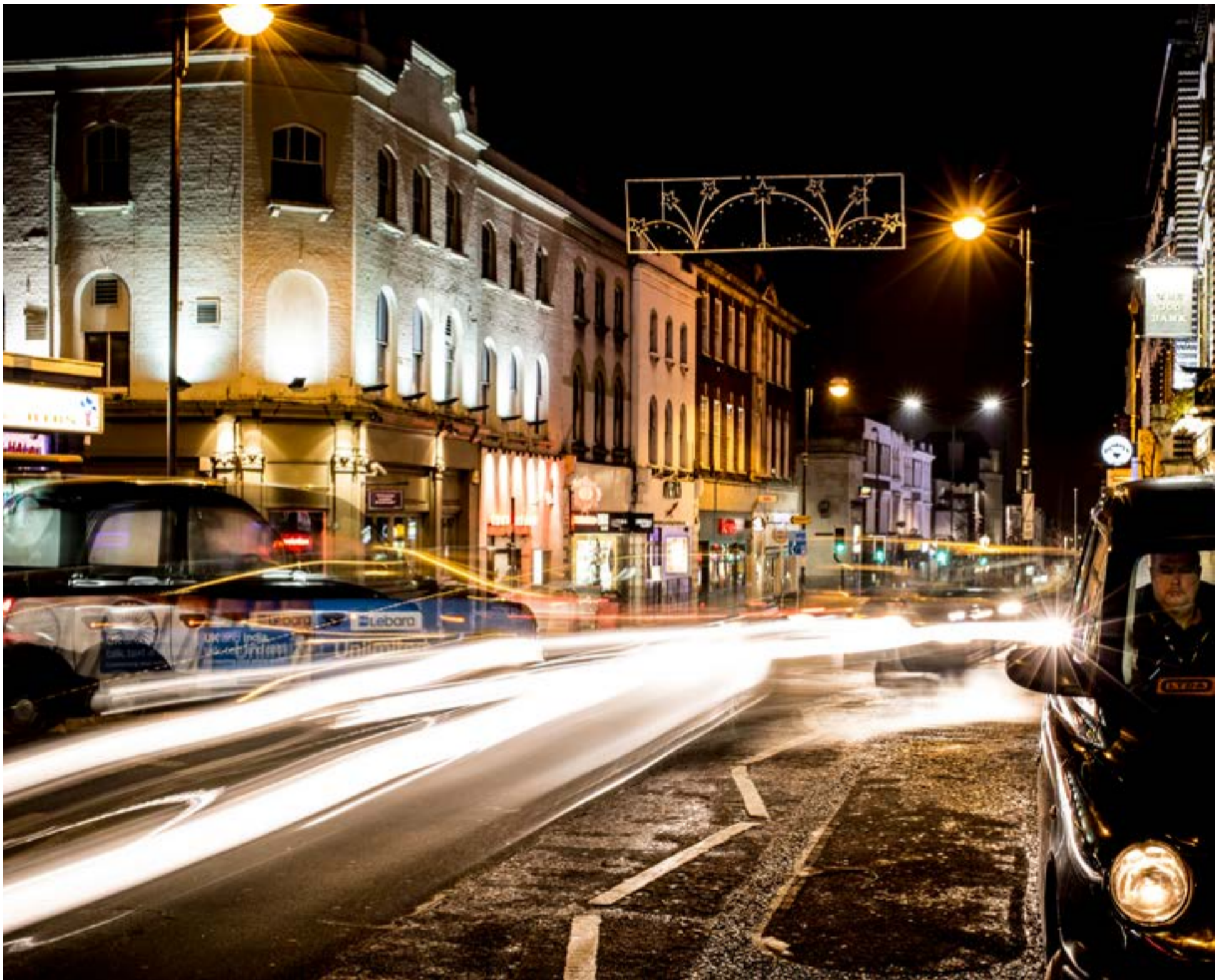
Calle en Sutton, Londres. Se aprecian edificios iluminados y las estelas de luz de vehículos en movimiento, incluyendo un taxi negro a la derecha.