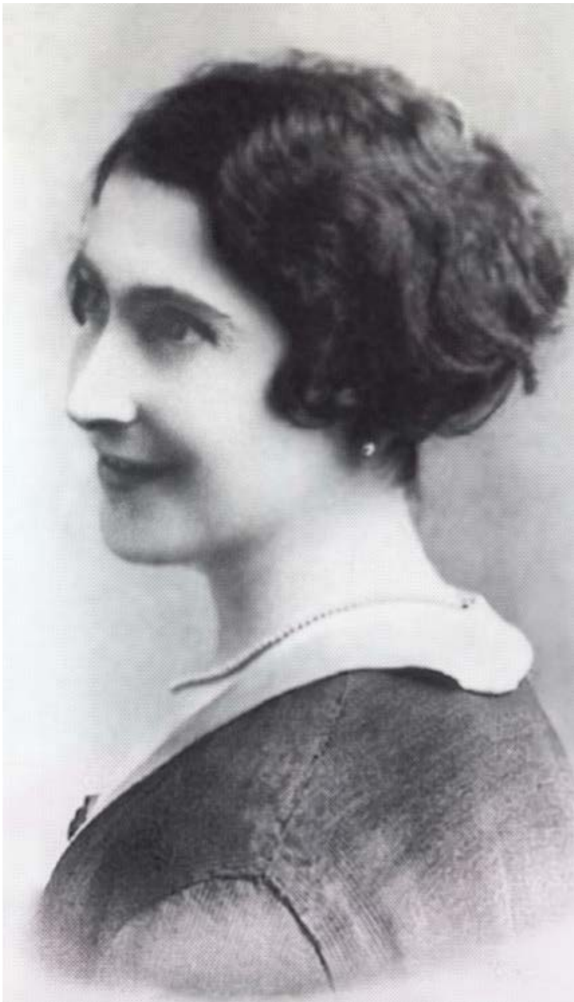
Jeanne Calment (1875-1997) la mujer más anciana del mundo

Asimismo, los reportes de la época destacan que Cal-