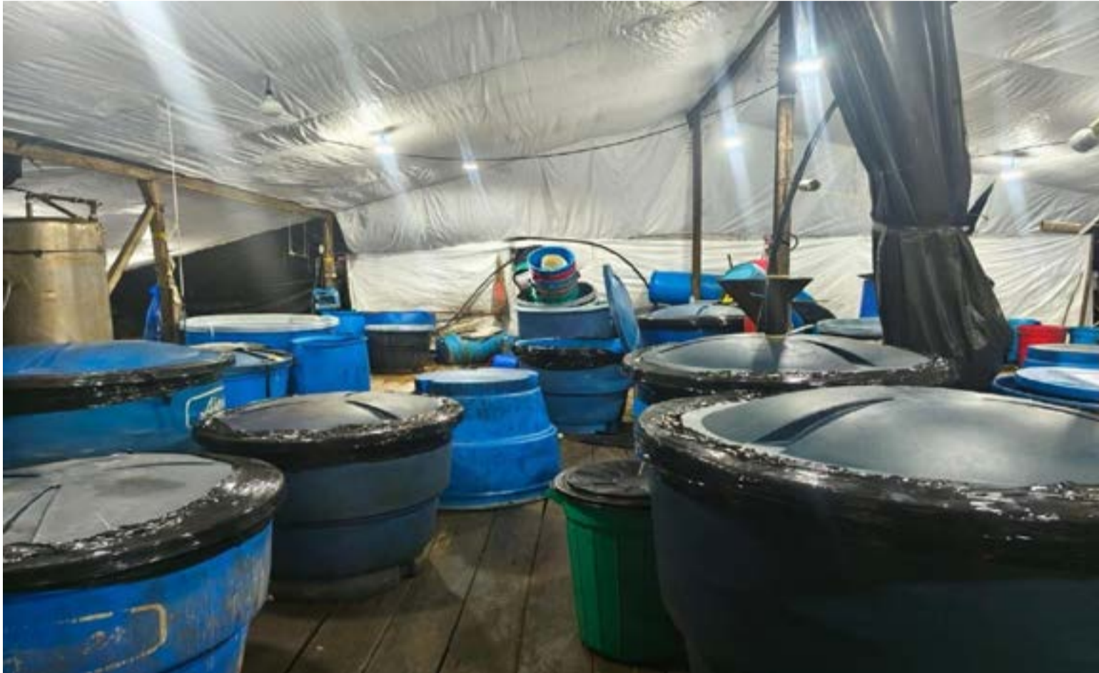
Las autoridades colombianas incautaron más de 2.600 galones de gasolina y 10 toneladas de cemento en Caquetá durante una operación conjunta contra las economías ilegales. Este cargamento, interceptado en corredores viales y fluviales, tenía como destino final los laboratorios de procesamiento de cocaína de las disidencias de las FARC.

Fuentes oficiales confirmaron que, aunque no se presentaron capturas durante el procedimiento, esta incautación frena de manera temporal la producción de toneladas de clorhidrato de cocaína. Esto se traduce en una pérdida millonaria para las finanzas de estas organizaciones criminales, debilitando su capacidad logística para adquirir armamento avanzado y material de guerra.